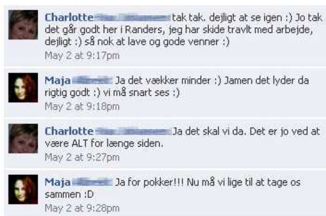
Billede 4 Maja i konflikt, om hun og hendes veninde i virkeligheden gider at ses når de i forvejen ikke har set hinanden længe. (Bilag 2, s. 2)